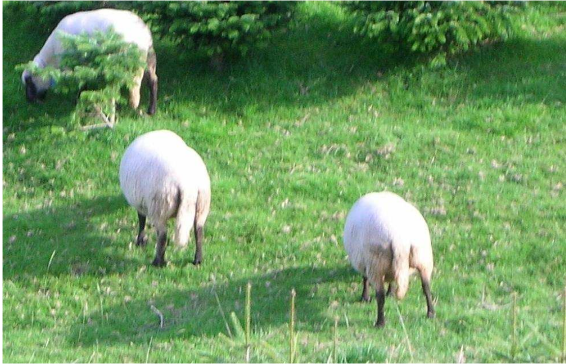
Figuur 2 Voorbeeld van Brits schapenras dat in land van herkomst gecoupeerd wordt. De Shropshire wordt vrijwel zonder uitzondering in Engeland gecoupeerd zoals op de onderste foto te zien is. Op de bovenste foto staan ongekoupeerde Shropshires die in de bergen in Zwitserland gehouden worden om de vegetatie in sparrenplantage's kort te houden. De veronderstelling is dat in de bergen door minder vochtige omstandigheden en een ander dieet geen problemen optreden met myiasis, en in de laaglanden wel.